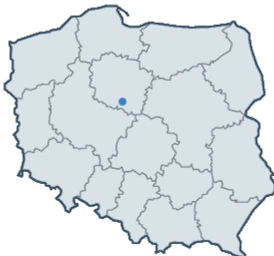
Rys. 1. Lokalizacja miejscowości Toporzyszczewo Stare na terenie Polski